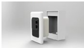
USA - SEINGLE WALL GANG