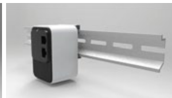
DIN RAIL INSTALLATION