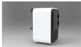
WL-API3150-040 - DIN SIDE VIEW - DIN RAIL MOUNTING