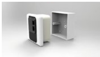
EU - WALL SINGLE GANG